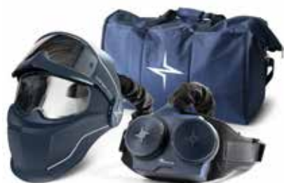
Evolution Vision 65FM Air Kit avec cagoule Evolution Vision 65FM Air: