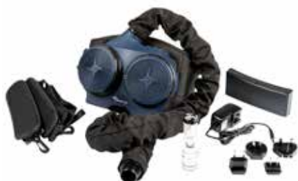
Evolution Air (Kit de ventilation complet)