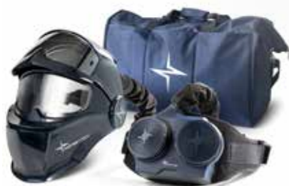
Evolution Vision 65F Air Kit avec cagoule Evolution Vision 65F Air:

Pare-étincelles et cachefiltre Protection des filtres contre les étincelles du soudage