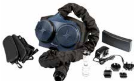
Evolution Air (Komplette Gebläseeinheit)