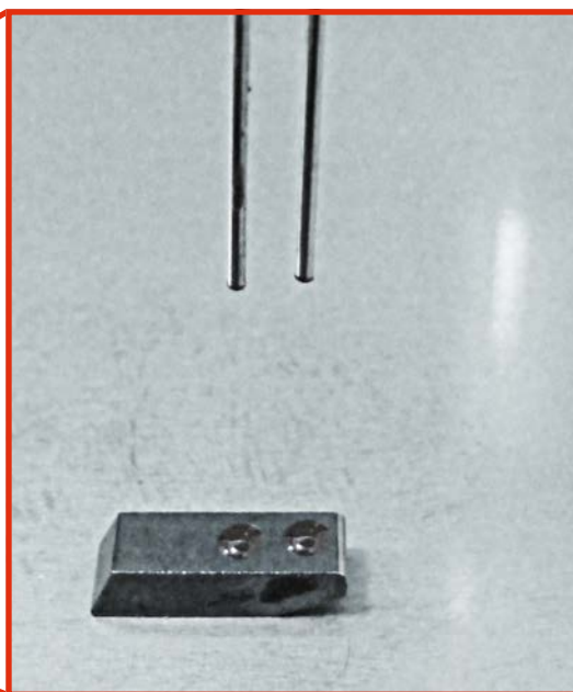
Sägeblatt-Lötautomat – Flussmitteldosierung